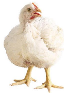
Gambar 2.2 Ayam Bloiler (japfacomfeed.co.id)

Ayam bloiler atau yang disebut juga ayam ras pedaging (bloiler) adalah jenis ras unggulan hasil persilangan dari bangsa-bangsa ayam yang memiliki daya produktivitas tinggi, terutama dalam memproduksi daging ayam. Ayam bloiler merupakan hasil perkawinan silang dan sistem berkelanjutan sehingga mutu genetiknya bisa dikatakan baik. Ayam bloiler merupakan ternak yang paling ekonomis bila dibandingkan dengan ternak lain, kelebihan yang dimiliki adalah kecepatan pertumbuhan/produksi daging dalam waktu yang relatif cepat dan singkat atau sekitar 4 – 5 minggu produksi daging sudah dapat dipasarkan atau dikonsumsi. (Putra, Maulana and Fitriyah, 2018)