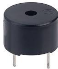
Gambar 2.6 Buzzer

manusia. Setiap buzzer elektronika memerlukan input berupa tegangan listrik yang kemudian diubah menjadi getaran suara atau gelombang bunyi yang memiliki frekuensi berkisar antara 1 -5 KHz. Prinsip kerja buzzer hampir sama dengan loud speaker, buzzer terdiri dari kumparan yang terpasang pada diafragma dan kemudian kumparan tersebut dialiri arus sehingga menjadi elektromagnetik. (Munandar, 2019)