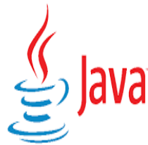
Gambar 2.12 Logo Java (Duniaikom .com)

Java adalah bahasa berorientasi objek dengan unsur seperti bahasa C++ dan bahasa lainnya, java diciptakan pada tahun 1991, oleh James Gosling yaitu seorang developer dari Sun Microsystems yang kemudian berkembang dan digunakan untuk menciptakan Executable. Java salah satu bahasa pemrograman yang populer digunakan untuk mengembangkan aplikasi mobile, desktop, hingga website. Digunakan untuk pengembangan aplikasi untuk perangkat-perangkat cerdas yang dapat berkomunikasi melalui internet atau jaringan komunikasi. (Farozi, 2020)