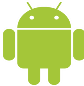
Gambar 2.10 Logo Android