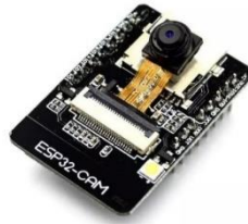
Gambar 2.5 Modul ESP32-CAM

microSD difungsikan untuk menyimpan gambar dan juga pin GPIO yang dapat digunakan untuk untuk menghubungkan dengan berbagai perangkat. Model Esp32-cam yang umum digunakan adalah dengan modul kamera OV2640 (Haris Bachtiar and Perdana Surya, 2022).