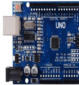
Gambar 2. 3 Arduino Uno

(Heri Andrianto, 2017). Jenis ini adalah yang paling banyak digunakan, versi terakhir Arduino uno R3, untuk pemrogramannya cukup menggunakan koneksi USB type A atau type B, sama seperti yang digunakan pada USB printer.