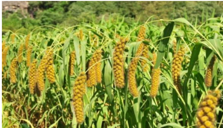
Gambar 1. Tanaman Jewawut

Tanaman jewawut dapat tumbuh di daerah tropis dan subtropis. Tanaman ini memiliki adaptasi yang baik pada daerah yang curah hujan rendah sampai daerah kering. Dibandingkan dengan tanaman yang lain, tanaman jewawut memiliki batang yang lurus dan berbuku-buku yang ditutupi oleh kumpulan seludang daun saling bertaut satu sama lain. Tanaman ini memiliki panjang berkisar antara 50-75 cm. Daun tanaman ini berbentuk seperti pipa yang langsing dan memanjang dengan ujung meruncing serta permukaan daun mempunyai