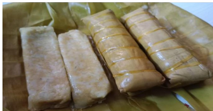
Gambar 2 Buras Jewawut

Di Kecamatan Balanipa masyarakat lokal mengolah jewawut menjadi makanan tradisional. Makanan tradisional merupakan makanan khas daerah dengan bahan yang digunakan bersumber dari bahan pertanian tempatan dan dibuat dengan teknik dan memakai peralatan tradisional yang telah berkembang secara khusus di daerah serta dimasak sesuai dengan resep secara turun temurun yang telah dikuasai oleh masyarakat lokal. Makanan tradisional merupakan salah satu ciri keanekaragaman budaya yang ada di Indonesia. Makanan tradisional juga berfungsi sebagai identitas setiap daerah karena memiliki cita rasa yang berbeda sesuai dengan lingkungan, kebiasaan, simbol, peraturan, serta pola konsumsi yang sudah diwarisi turun temurun pada setiap daerah (Hidayah, 2019)