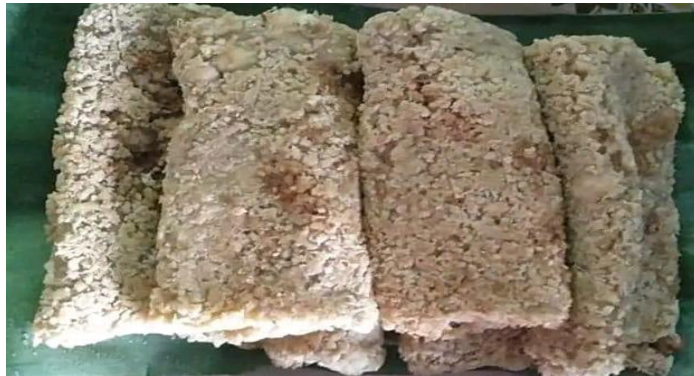
Gambar 3 Japa Jewawut

masyarakat lokal di Kecamatan Balanipa bisa membuatnya butuh keterampilan khusus dengan takaran air santan yang tepat.