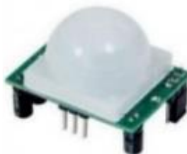
Gambar 2. 5 Sensor PIR ( Passive Infrared Receiver )

Sensor PIR ( Sensor Infrared Receiver ) adalah sensor yang digunakan untuk mendeteksi adanya pancaran infra merah. Sensor PIR bersifat pasif, artinya sensor ini tidak memancarkan sinar infra merah tetapi hanya menerima radiasi sinar infra merah dari luar. (Juliansyah & Nadiani, 2021)