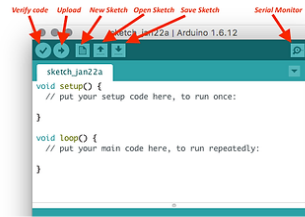
Gambar 2.10 Arduino IDE