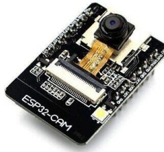
Gambar 2. 4 ESP32-CAM