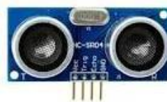
Gambar 2. 6 Sensor Ultrasonik HC-SR04

Sensor ultrasonik adalah perangkat yang memanfaatkan prinsip gelombang ultrasonik untuk mengukur jarak atau mendeteksi keberadaan objek. Sensor ultrasonik adalah sebuah sensor yang berfungsi untuk mengubah besaran fisis (bunyi) menjadi besaran listrik dan sebaliknya. Cara kerja sensor ini didasarkan pada prinsip dari pantulan suatu gelombang suara sehingga dapat dipakai untuk menafsirkan eksistensi (jarak) suatu benda dengan frekuensi tertentu. Disebut sebagai sensor ultrasonik karena sensor ini menggunakan gelombang ultrasonik (bunyi ultrasonik ). (Sujadi et al., 2018)