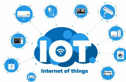
Gambar 2.1 Internet Of Things

Internet Of Things (IoT) merupakan segala aktivitas manusia dengan benda, benda dengan benda atau perangkat yang memiliki kemampuan mentransfer data melalui jaringan atau internet. Contohnya pada rumah pintar, dimana rumah secara otomatis dapat menyesuaikan suhu bahkan pencahayaan sesuai kebutuhan. Sensor dan perangkat yang terhubung bekerja sama untuk menciptakan lingkungan hidup yang lebih ideal .