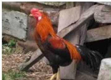
Gambar 2. 3 Ayam Kampung

Ayam kampung merupakan salah satu varietas ayam buras lokal Indonesia ( native chicken ) hasil domestikasi ayam hutan merah ( Gallus gallus ) yang telah dipelihara sejak lama dan tersebar luas di wilayah Indonesia. (Edowai et al., 2019)