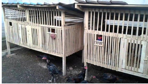
Gambar 2. 2 Peternakan Ayam Kampung