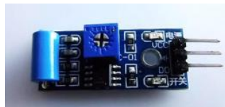
Gambar 2.9 Sensor SW-420

Sensor SW-420 adalah pendeteksi getaran yang bereaksi terhadap getaran dari berbagai sudut. Sensor getar SW-420 menghitung gempa dengan cara mendeteksi getaran berupa Hertz. (Kristanto 2023)