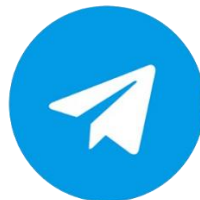
Gambar 2. 9 Telegram

Aplikasi Telegram merupakan salah satu aplikasi sesuai dengan kebutuhan masyarakat. Aplikasi Telegram memungkinkan pengguna untuk dapat mengirimkan pesan yang sifatnya rahasia dan pesan tersebut sudah dapat dienskripsi end-to-end sebagai keamanan tambahan. Di dalamnya terdapat fitur bot yang digunakan sebagai pemberi peringatan dan dapat mengecek keamana pintu rumah melalui sensor yang sudah terhubung ke perangkat. (Arifin & Frenando, 2022)